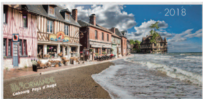
illustration fantaisiste de la complémentarité entre la mer et la campagne avec l'entrée de Beuvron dans NCPA.

Aujourd'hui tous les Beuvronnais savent que nous sommes entrés, le 1 er janvier 2018, dans la Communauté de Communes de Normandie-Cabourg-Pays d'Auge, présidée par Olivier Paz, maire de Merville-Franceville.